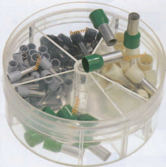
Type SD 4016