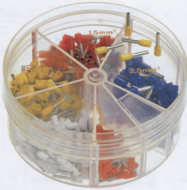
Type SD 0525