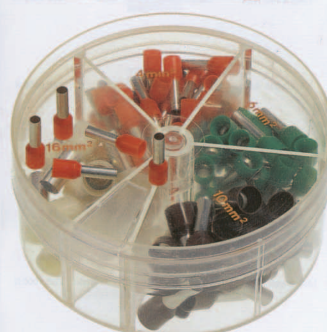
Type MSD 4016