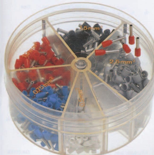
Type MSD 0525