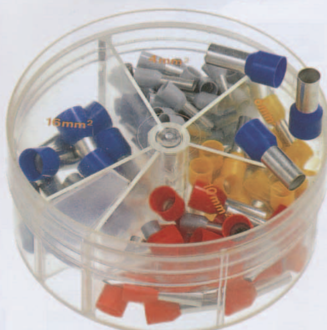
Type DSD 4016